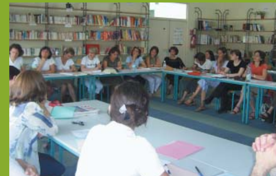
Deux fois par an, projets, bilan, rencontres et débats nourrissent et enrichissent les journées pédagogiques