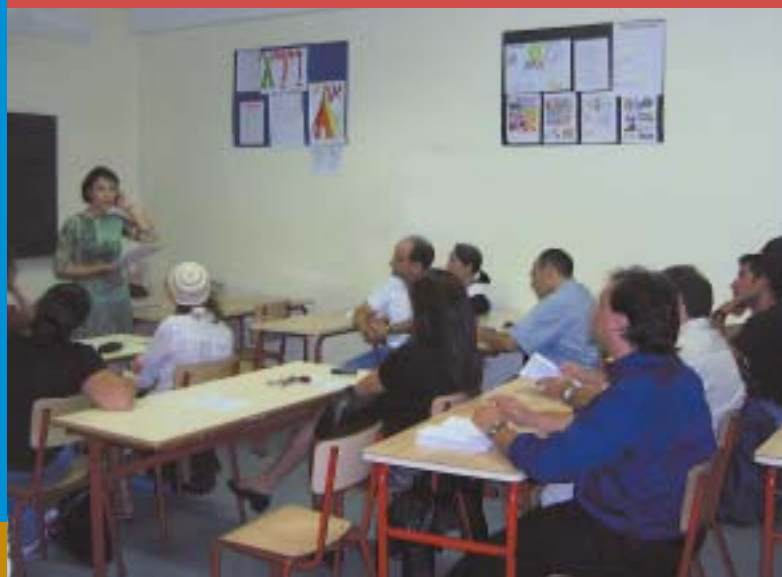
Beaucoup se sont retrouvés sur les bancs des classes pour mieux appréhender le fonctionnement des cours.

C'est ce dernier qui a ouvert la réunion en présence de tous les parents d'élèves ainsi que de son équipe pédagogique. Son discours a été précédé d'une présentation du nouveau site Internet de l'école par Monsieur Raynaud, au cours de laquelle les parents ont pu constater la qualité du travail accompli en vue d'une meilleure diffusion du message de l'école.